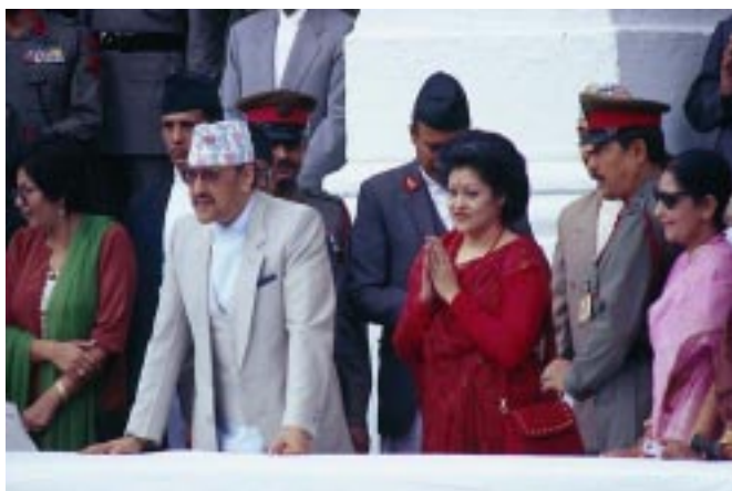
Leurs Majestés, le roi et la reine du Nepal, rendant hommage à la Kumari lors d'Indrajatra

Krishnastami (juillet-août): C'est l'anniversaire de la naissance du Seigneur Krishna, célébré par d'impressionnantes cérémonies dans les temples de Krishna à Patan et Changu Narayan.