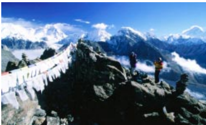
Trekkeurs sur le sommet de Kalapathar