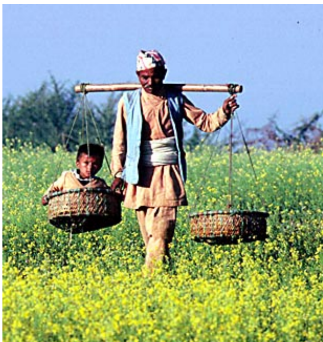
Un fermier promène son fils dans un champ de moutarde

Kanchenjunga, est un des meilleurs endroits pour contempler le lever et le coucher du soleil.