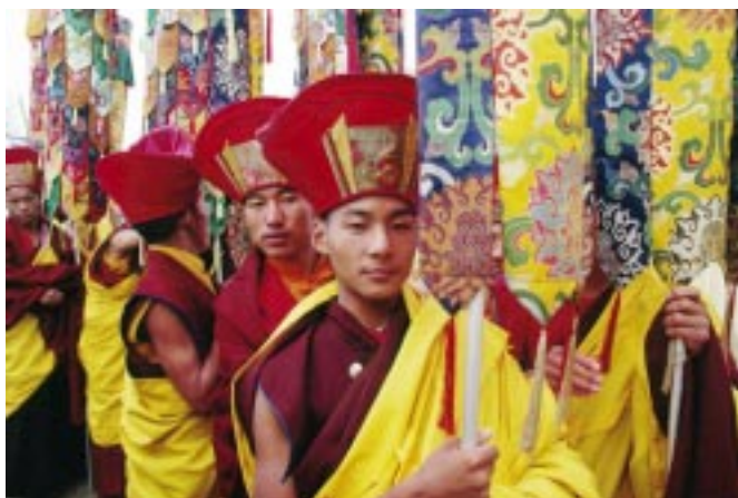
Moines bouddhistes lors de l'intronisation d'un Rinpoché à Bouddhanath

régions du Nord du Népal, ainsi qu'à Bouddhanath à Kathmandou.