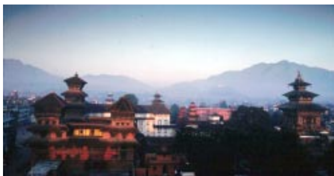
Durbar Square (Place Royale) de Kathmandou

Chabahil: L'adorable stupa de Chabahil passe pour avoir été construit par Charumati, la fille de l'empereur indien Ashok, au 3 e siècle avant J.-C. On peut voir d'anciennes statues autour du stupa.