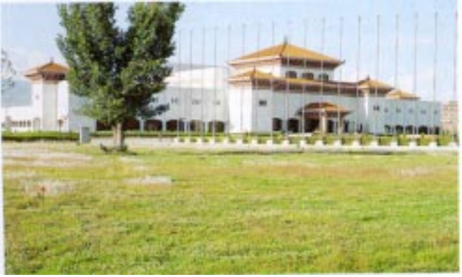
Birendra International Convention Center

Les hôtels de Pokhara sont eux aussi pourvu de salles de conférence équipées.