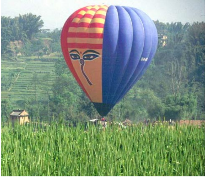
Une montgolfière au-dessus des champs verts

majeure au Népal. Pour ceux qui ne peuvent effectuer de trek pour une question de temps ou autre, c'est le moyen d'avoir une vue panoramique de l'Himalaya en à peine une heure.