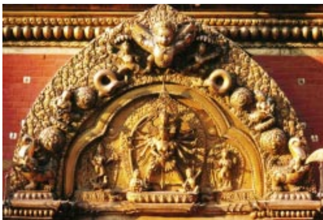
Merveille architecturale de Bhaktapur Golden Gate

colonne, faisant face au palais, se trouve une magnifique statue du roi Bhupatindra Malla en prière. Le site a été inscrit au patrimoine mondial par l'UNESCO en 1979. Par décision de la municipalité, à partir du 1 er janvier 2000 le prix de l'entrée s'élèvera à 750 Rs (SAARC : 20 Rs). Gratuit pour les enfants de moins de 12 ans.