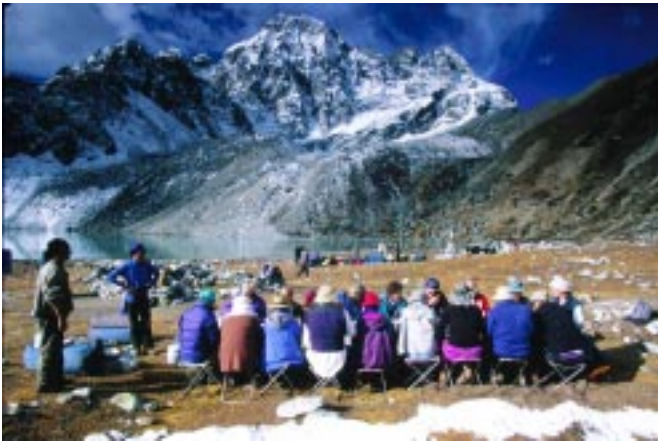
Petit-déjeuner dans la région de l'Everest

Le Népal est une des meilleures destinations au monde pour les activités d'aventure. La géographie du Népal concentre des paysages extrêmement variés sur une surface relativement modeste. Les contrastes en termes d'altitude permettent une spectaculaire variété de modes de vie, de faune et de flore. Le Népal est probablement le seul pays au monde où vous pouvez tour à tour escalader les plus hauts sommets de la planète, randonner dans une si belle campagne avec les pics aux neiges éternelles en toile de fond, et partir en safari dans la plus dense forêt de toute l'Asie Méridionale!