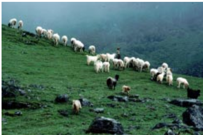
Un berger surveille ses mouton à Panch Pokhari, Gosainkunda

Situé à 133 km de Kathmandou, Charikot offre une vue spectaculaire sur le Mt Gaurishanker. Sur une hauteur à l'Est du village de Dolakha se trouve le fameux temple sans toit de Dolakha Bhimsen.