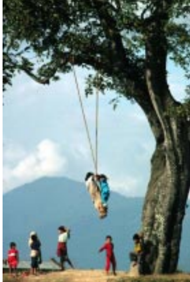
Des enfants sur la balançoire durant Dashain

Dashain ou Durga Puja (septembre-octobre): C'est la plus importante fête népalaise. Le pays entier vibre d'une joyeuse atmosphère de fête pendant cette période.