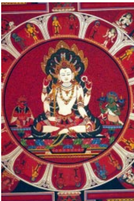
Peinture thanka du Bouddha

des hôtels regorgent de bijoux très tentants, de statues et autre artisanat népalais. Les thangkas sont l'une des meilleures opportunités du Népal. Chaque endroit a sa spécialité. Ainsi, Bhaktapur et la poterie. La Traditional Craftsman's Colony de Patan est un centre réputé d'artisanat népalais. Quand vous êtes à Patan, profitez-en pour acheter des objets de bois sculpté. Concernant les bijoux, on a le choix entre pierres brutes et articles sur mesure.