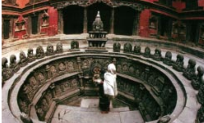
Bains Royaux de Sundari Chowk à Patan